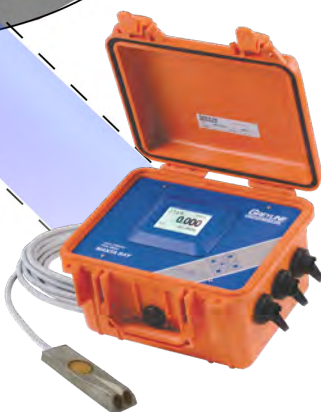
MantaRay Portabel logger Batteri/Nät Analog utsignal Pulsutgångar Reläutgångar Larm