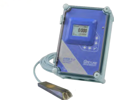
AVFM 6.1 Stationärt utförande Analog utsignal Pulsutgångar Reläutgångar Larm

Flödes hastigheten mäts med ultraljud genom dopplereffekten. Signalen reflekteras mot partiklar i flödet. Nivån mäts med ultraljud som reflekteras mot vätskeytan.