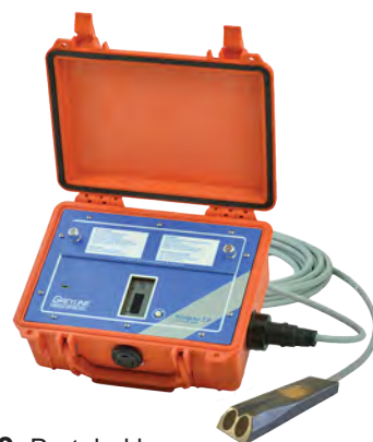
Stingray 2.0 Portabel logger Batteri PC-mjukvara