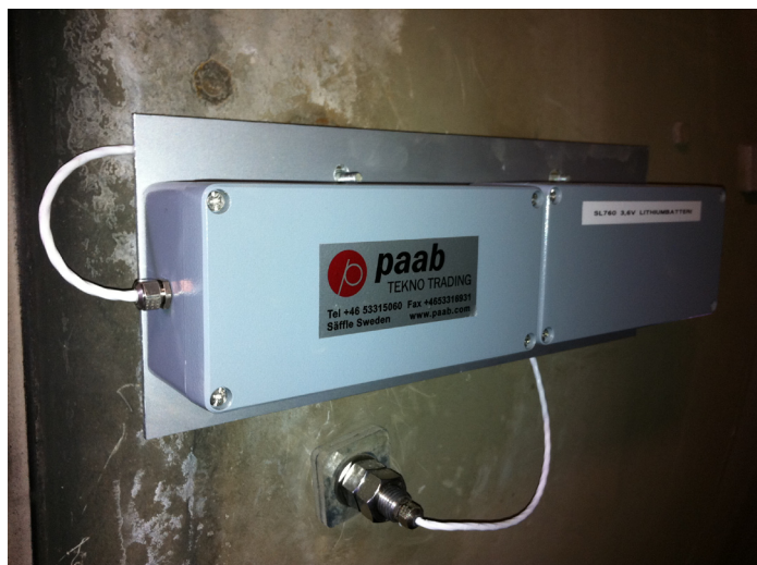
Bilden visar installation på Swerocks betongstation i Lidköping